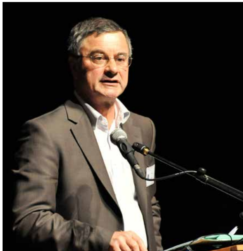
Retrouvez l'intervention de Xavier Nau sur www.apel.fr

X. N. L'idée de valeur implique potentiellement celle d'universalité : chacun voit bien que sans le partage d'un minimum de valeurs, la vie commune serait difficile. Au-delà, chacun estimant être dans le vrai voudrait voir reconnues par tous les valeurs qu'il professe, les estimant ainsi universelles. Mais l'exigence d'univer-