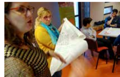
Lyon, 25 novembre 2017