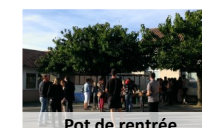
Pot de rentrée