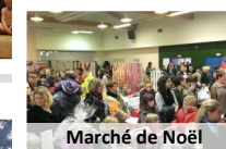
Marché de Noël