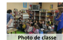
Photo de classe